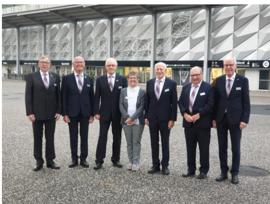
Comité central 2023

Nous avons bien travaillé au cours des trois dernières années, avec une équipe bien soudée, nous avons eu beaucoup de discussions, mais nous avons aussi finalement atteint bien des objectifs.